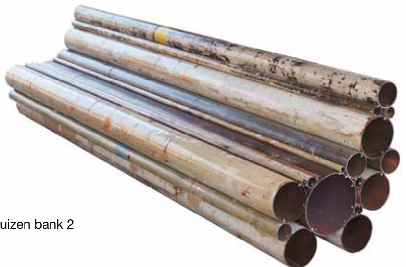
Buizen bank 2