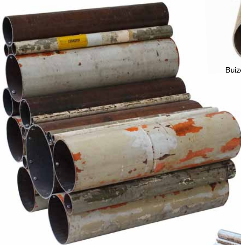
Buizen fauteuil 1

De modellen zijn genummerd met naam en door-nummering (fauteuil nr 1, bank nr 2 etc, etc).