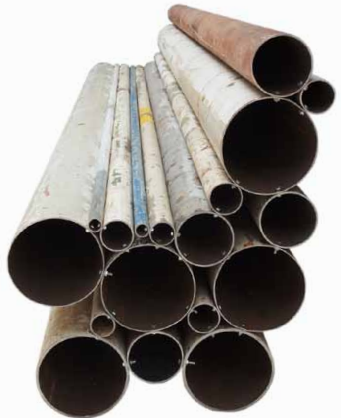
Buizen bank 3