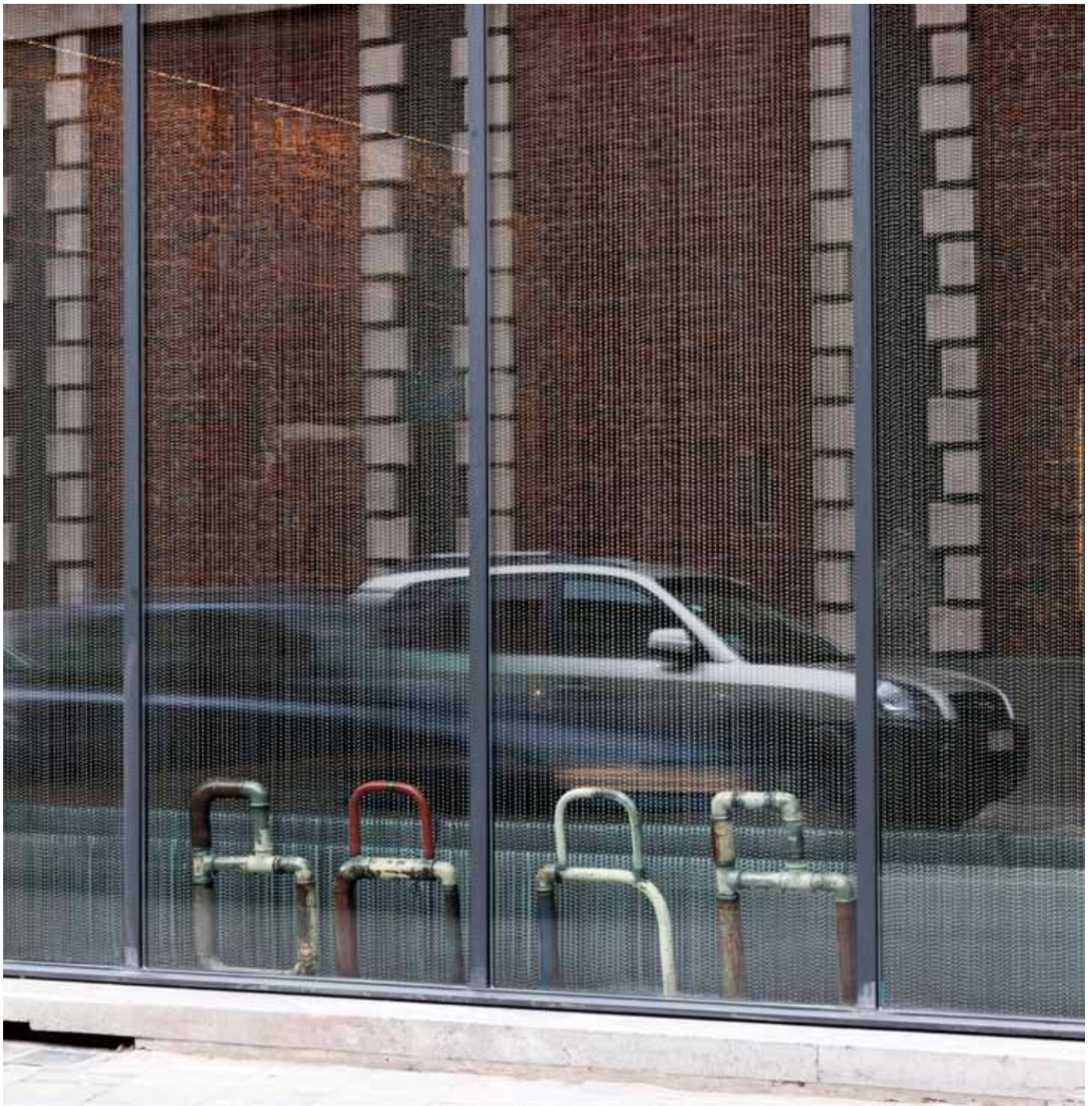
Bill board made of old construction pipes: "BAAR".

Year: 2013 Place: Gent Client: Club Baar In collaboration with: Lieven Munsschoot