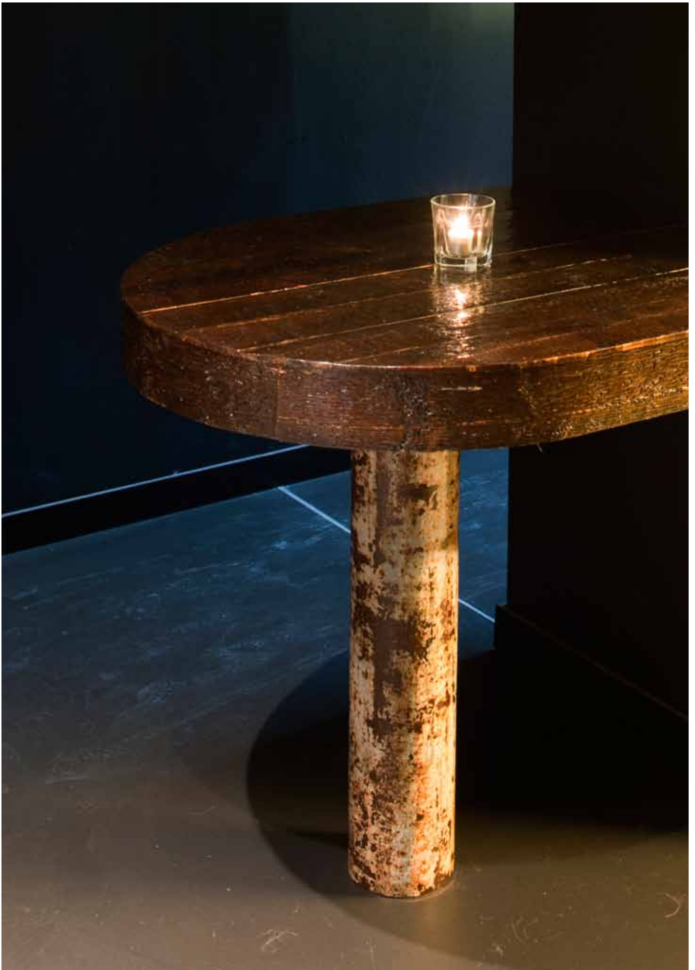
Detail: bar made of scrapwood, leg made of old construction pipes.