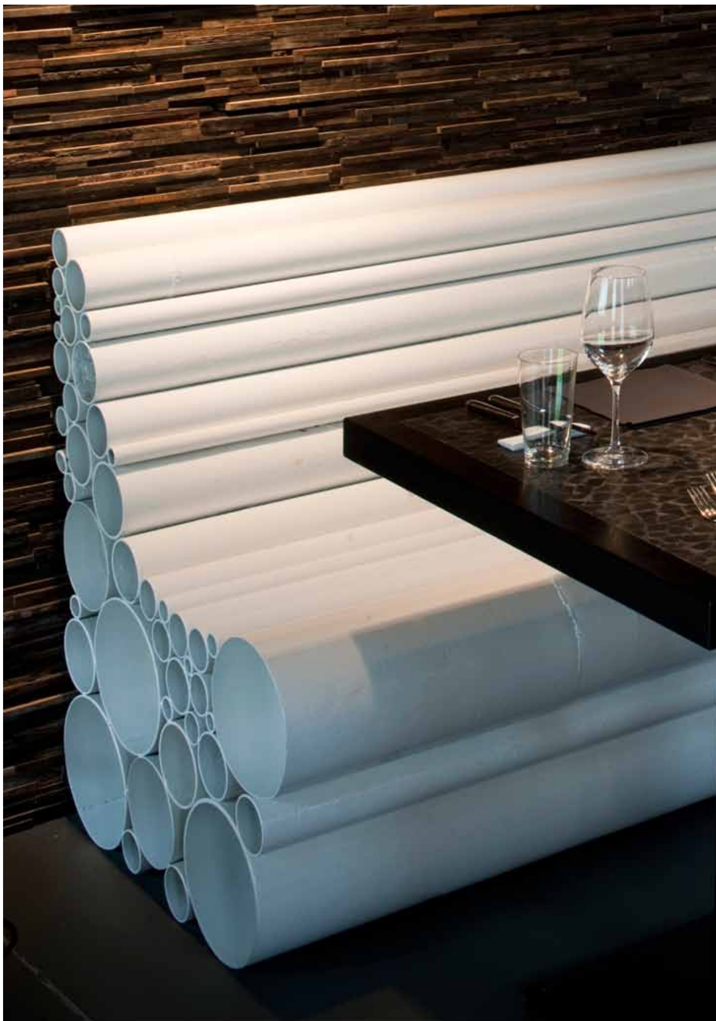
Detail: bench made of old construction pipes, white laquered.