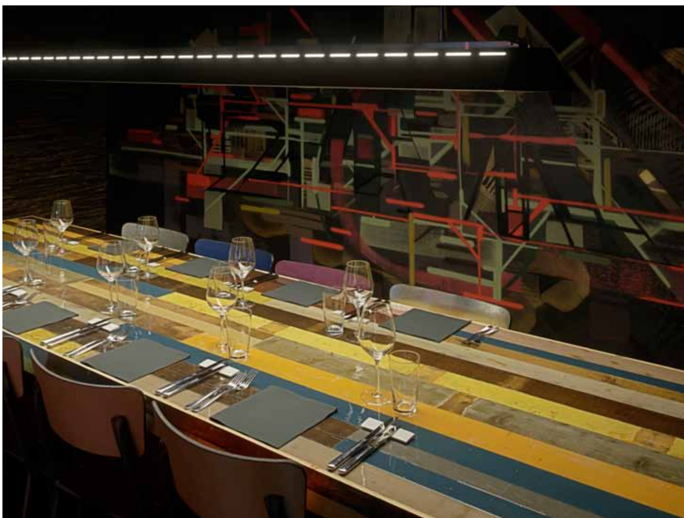
Scrapwood multicoloured canteen table. Large TL light.