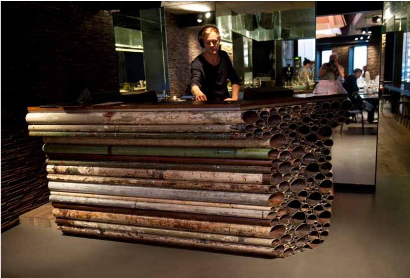
DJ booth made of old construction pipes.